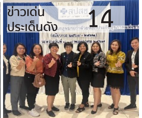
ข่าวเด่น ประเด็นดัง 14