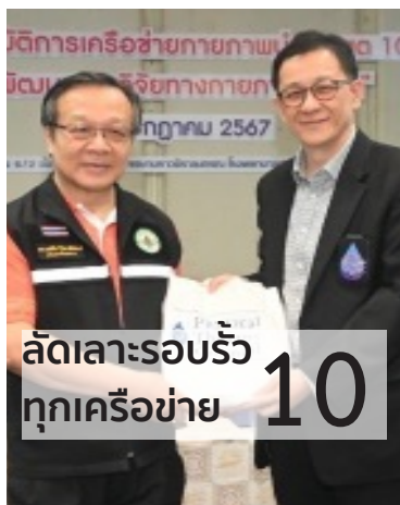
ลัดเลาะรอบรั้ว ทุกเครือข่าย 10