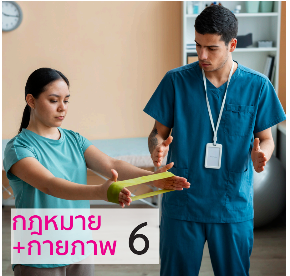
กฎหมาย +กายภาพ 6