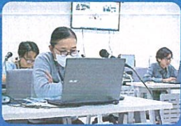
Face to Face